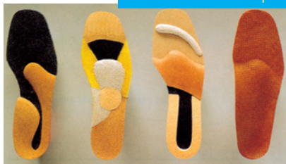
Semelles dont la prescription doit, si possible, décrire la nature de l'atteinte