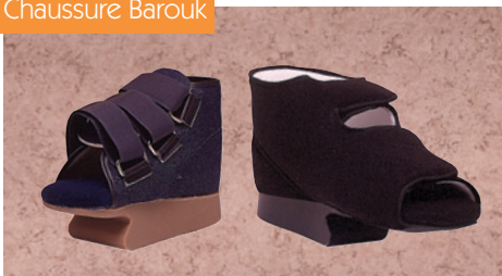
Chaussure de décharge totale de l'avant-pied (Dr. Barouk)