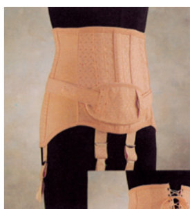
Ceinture pour femme