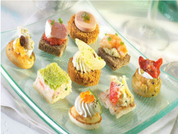
Herzhafte Cocktailhäppchen „Tradition“