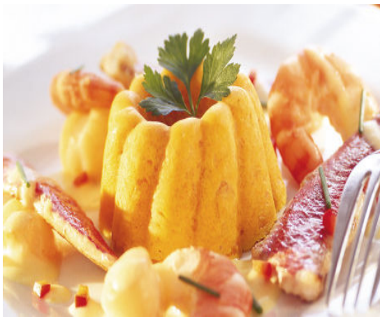
Gemüsebeilage: Guglhupf Karotte-Kumin