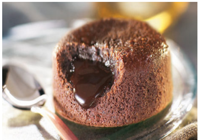
Dessert Fondant au Chocolat