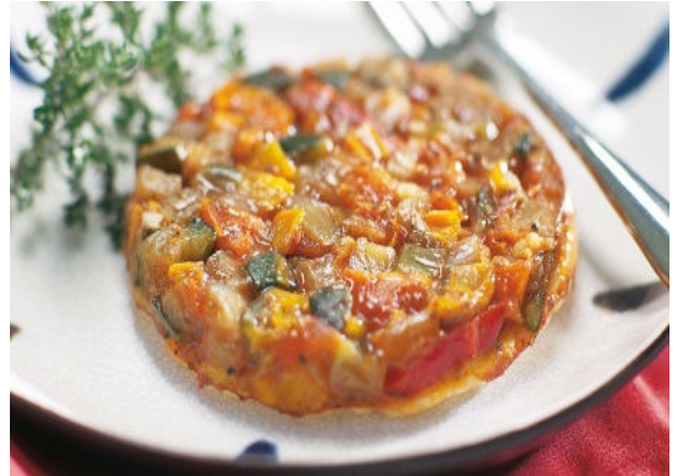
Vorspeise Tarte „Sonnengemüse“