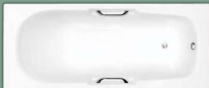
Olenne avec poignées