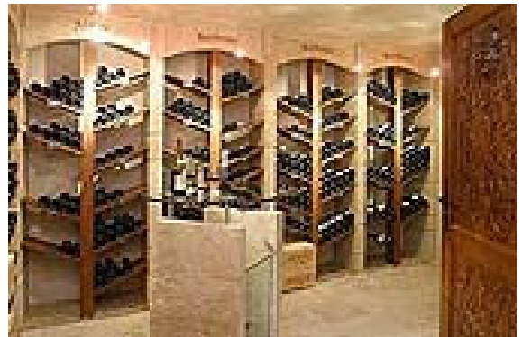
Cave de Bourgogne