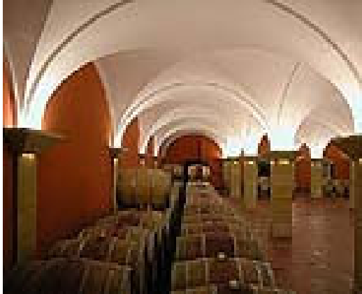
Di Arco Gewölbekeller